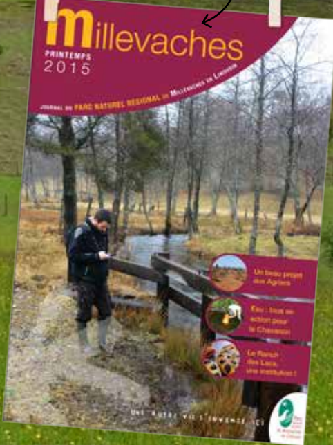
Journal du Parc