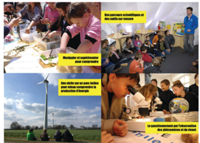
Des parcours scientifiques et des outils sur mesure